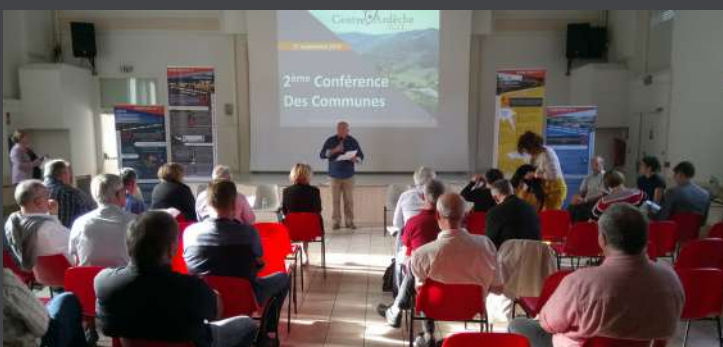
Conférence des communes, 27 septembre 2019.

Présentation des Ambitions du PADD, retour d'expérience du SCoT Apt Luberon, Table ronde : Quelle économie pour le développement et l'attractivité du Centre Ardèche ?