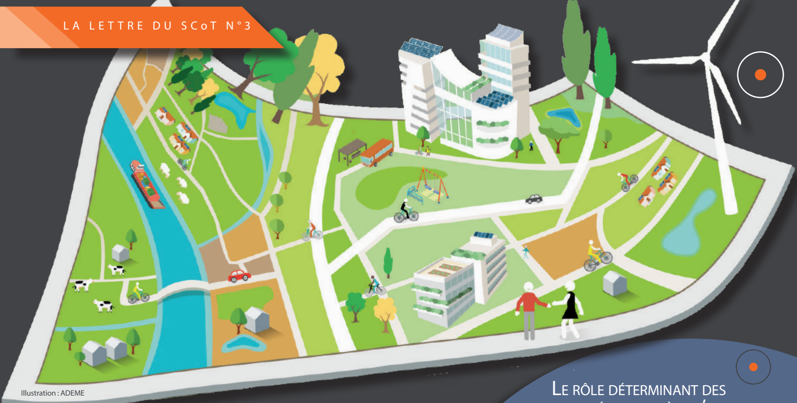
Illustration : ADEME